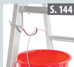
Eimerhaken für Sprossenleitern