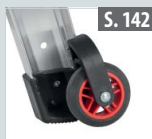
Rollenset für Teleskopleitern