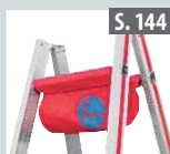
Werkzeugtasche für Aluleitern