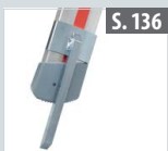
Fußspitzenset schwenkbar für Teleskopleitern