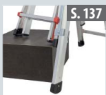
Fußverlängerung für Teleskopleitern