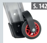
Fußspitzenset schwenkbar für Teleskopleitern