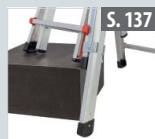
Fußverlängerung für Teleskopleitern