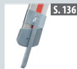
Fußspitzenset schwenkbar für Teleskopleitern